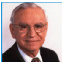
Ozires Silva BRASIL